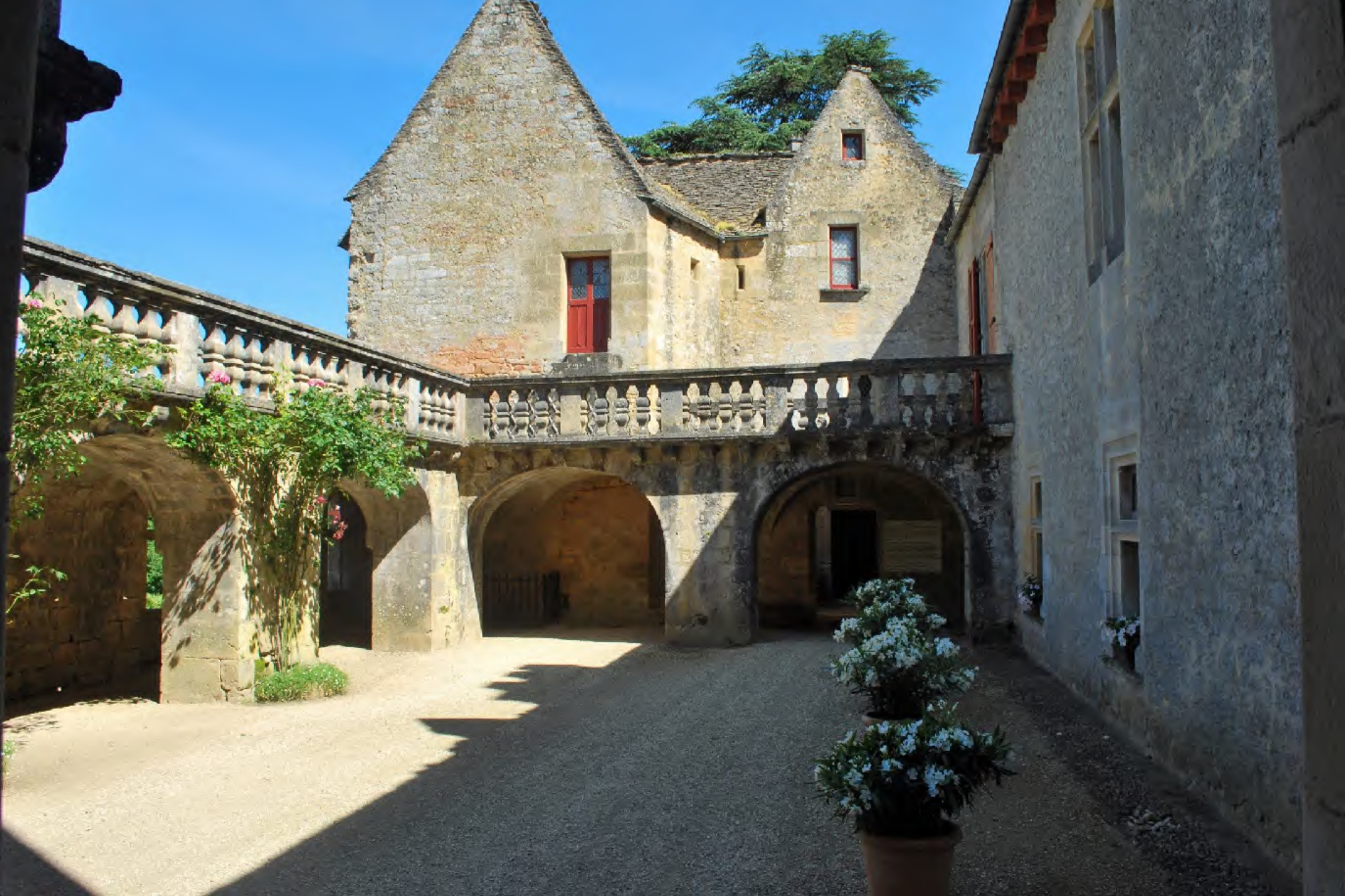
Cour intérieure et terrasse du château