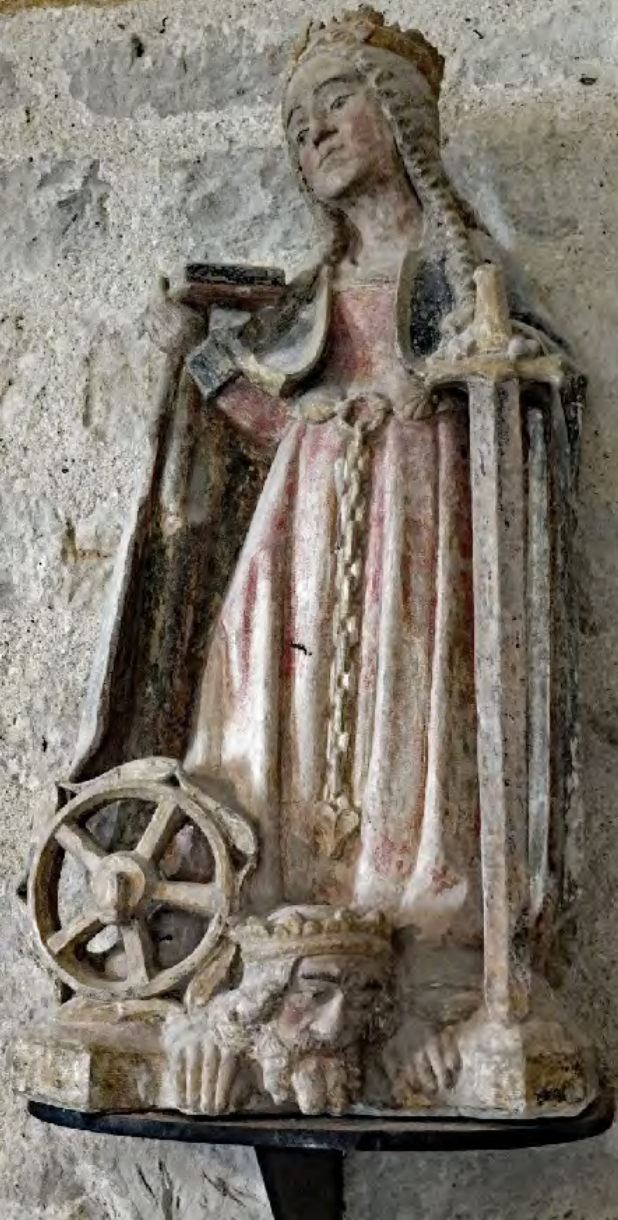
Statues polychromes en pierre calcaire (Ici : Sainte Catherine d'Alexandrie)