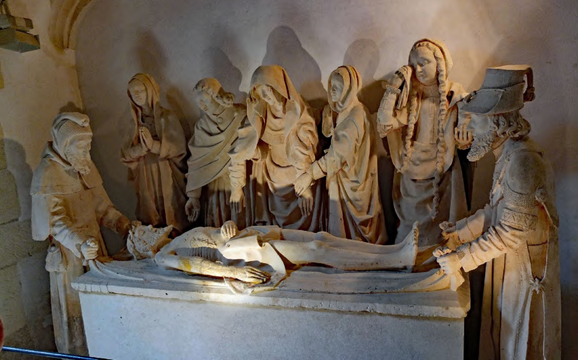
Salle capitulaire : la célèbre « Mise au tombeau » (sculpture de fin XV° - début XVI° s., autrefois polychrome)