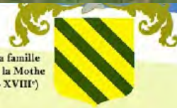
Les armes de la famille de Salignac de la Mothe Fenelon (XV e - XVIII e )