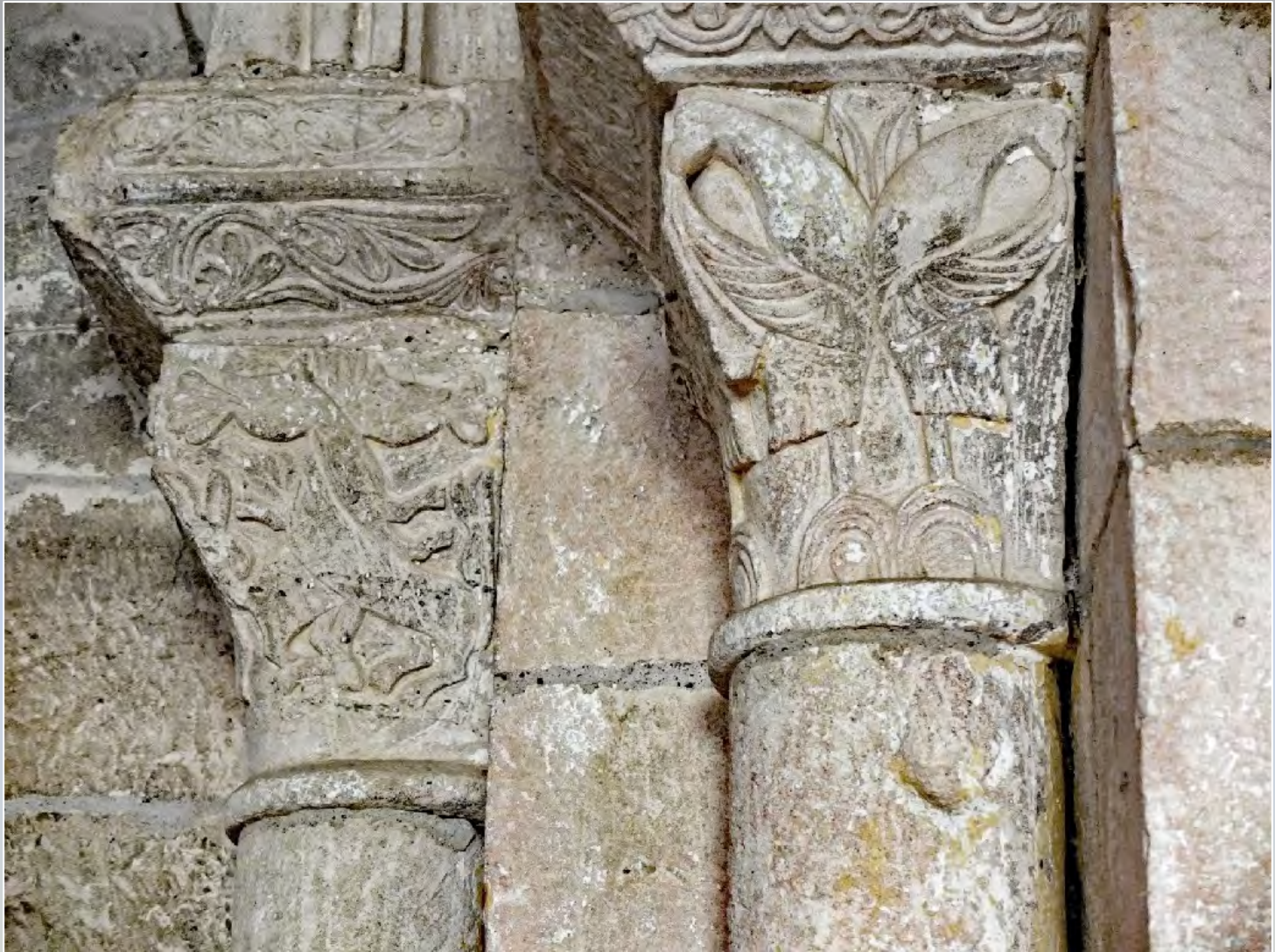
Eglise Saint Pierre : 2 exemples de la trentaine de chapiteaux sculptés