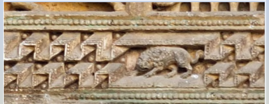
Animaux sculptés autour du tympan