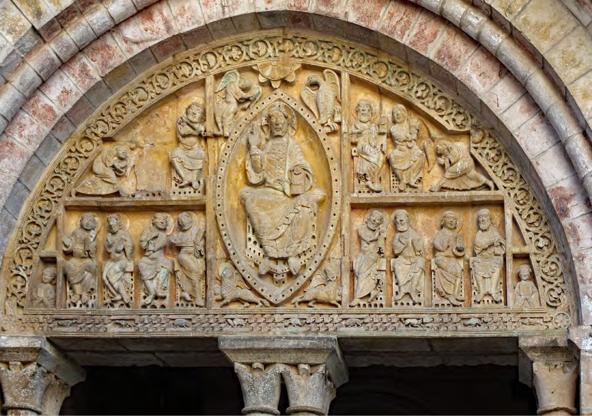
Le tympan de l'église Saint-Pierre : Christ en majesté entouré des apôtres