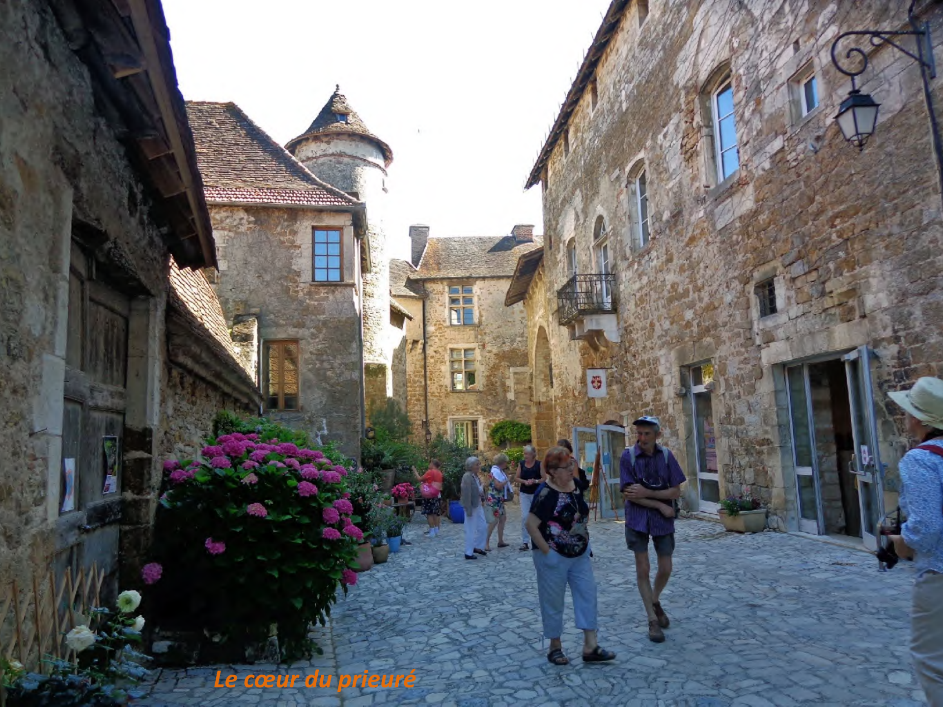
Le cœur du prieuré