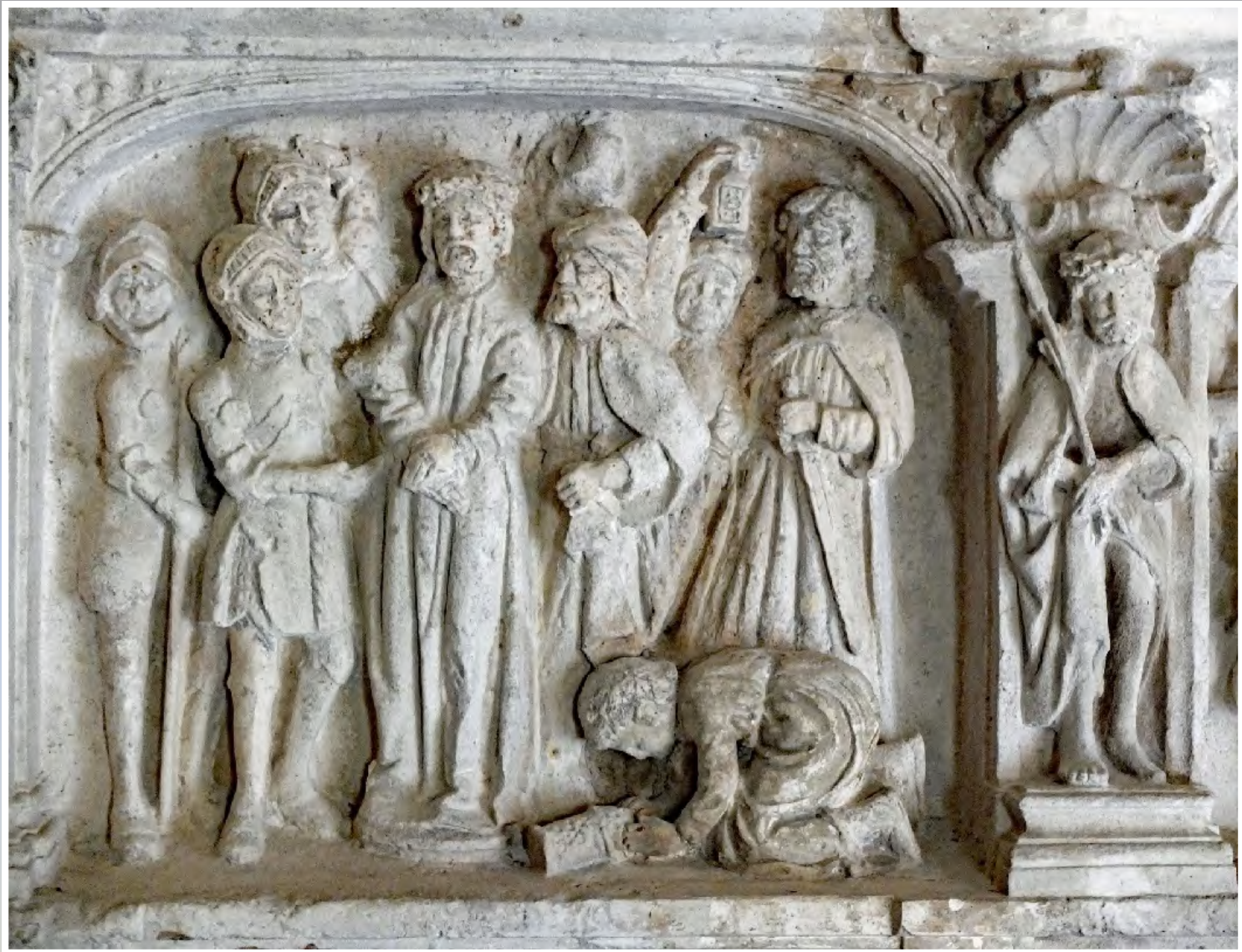
Détail du bas-relief : scène de l'arrestation du Christ