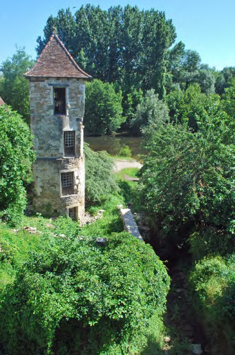
La tour Geneviève